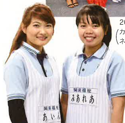
2018年3月卒業 (カンボジア3名、スリランカ1名) (ネパール1名、ベトナム1名)

現在は国籍や文化の違いを超え、利用者の尊厳を守り、自立支援を実践できる気付きのある介護福祉士を目指して頑張っています。